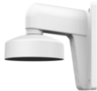
DS-1273ZJ-130-TRL Настенный кронштейн