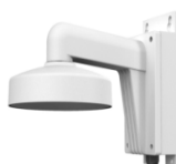
DS-1272ZJ-110B Настенный кронштейн