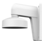
DS-1272ZJ-110 Настенный кронштейн